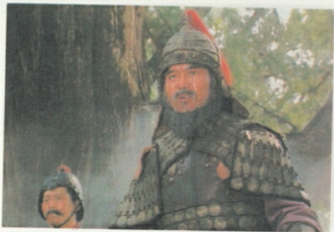
图5 邓艾率众将士亲往阴平，临行道：“渡过阴平小路，便可直取成都，诸将士皆可请功受赏！”将士道：“遵从将令，万死不辞！”