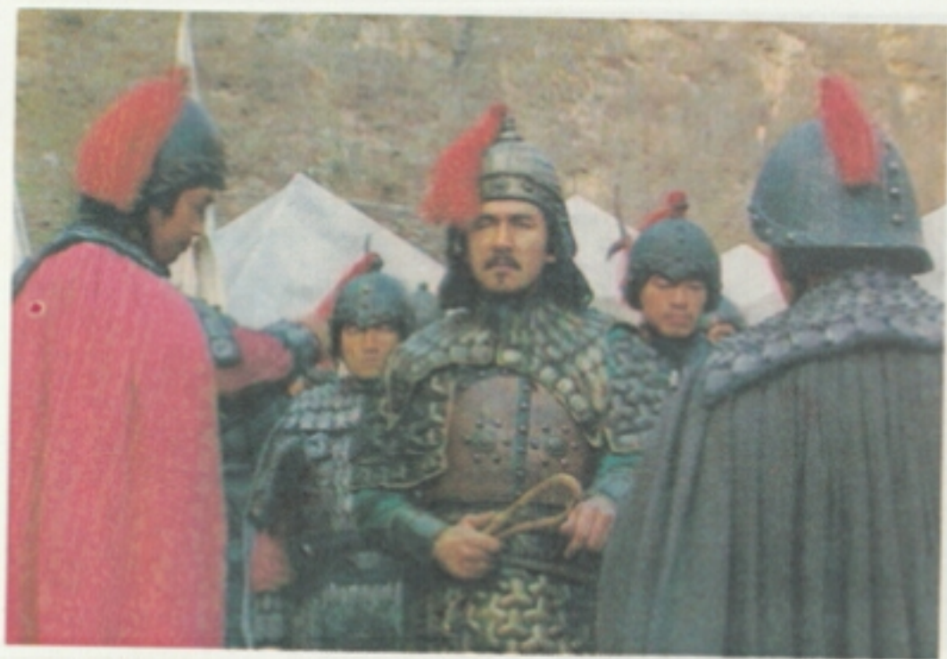
6 钟会得知邓艾已尽拔其寨，起兵阴平，暗笑邓艾不智。