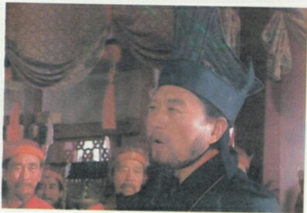
17 郤正急献策道：“速宣诸葛瞻领兵拒敌，成都可保。” 刘禅遂宣诸葛瞻引兵七万去迎魏军。