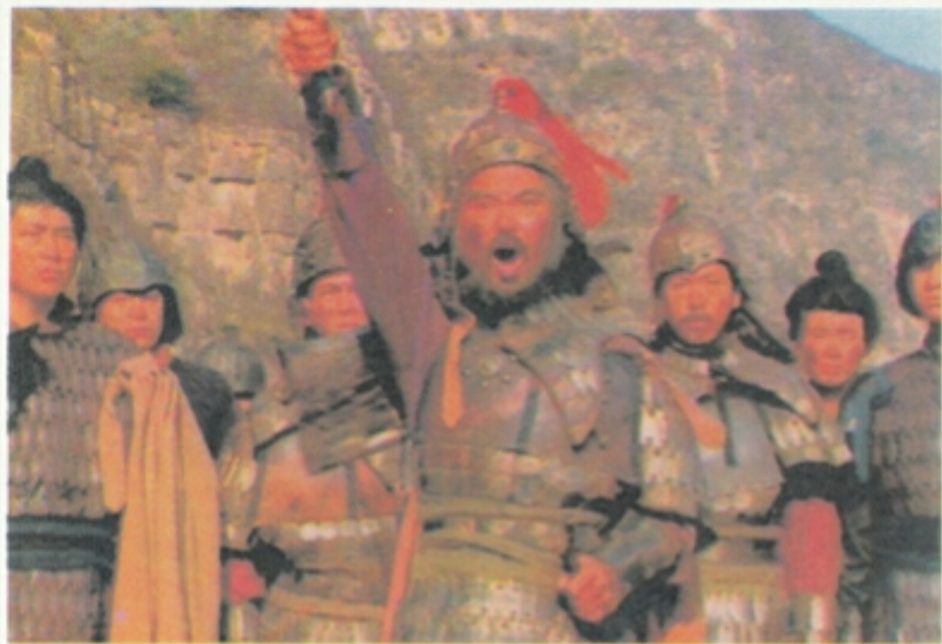
15 随后邓艾又重整兵马，举刀明誓，引兵二千，直取成都。