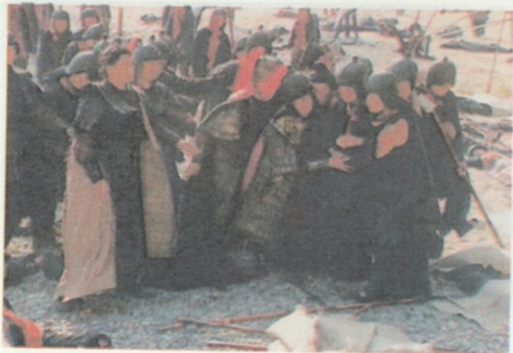
13 接着众将士皆效其法，纷纷滚下山去，下山之后，才见许多将士尽皆摔死。