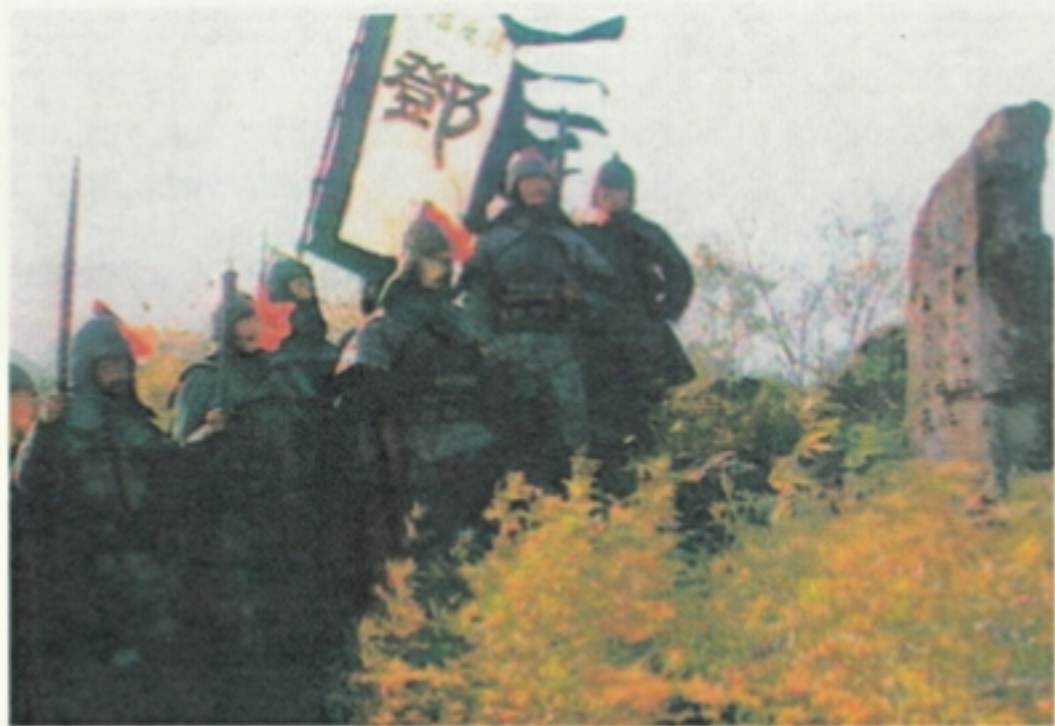
8 邓艾率领大军登上了摩天岭，历时二十余天，行程七百余里。所带三万大军，仅剩二千人马。