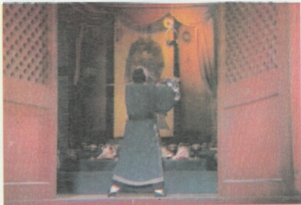
27 刘禅抚尸而哭，长子见状，遂撞剑自杀。刘湛悲痛欲绝，杀其二子，引剑自刎。