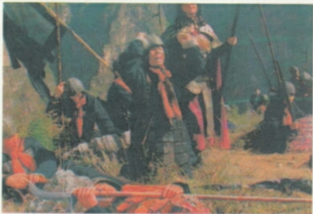
10 众将士至此，见已无路可走，进退不得，大哭不止。