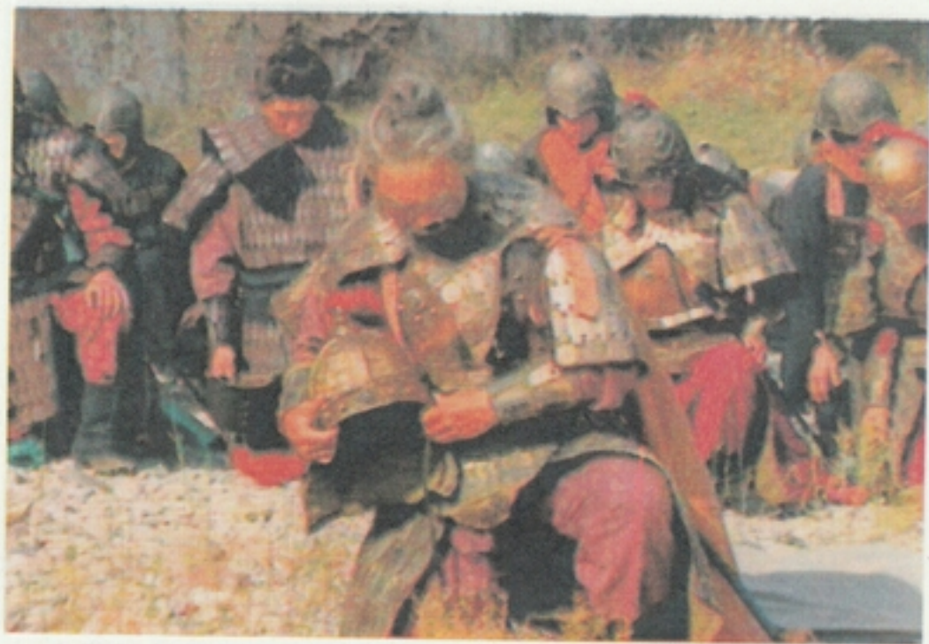
14 邓艾悲痛万分，脱下头盔，跪拜于地。