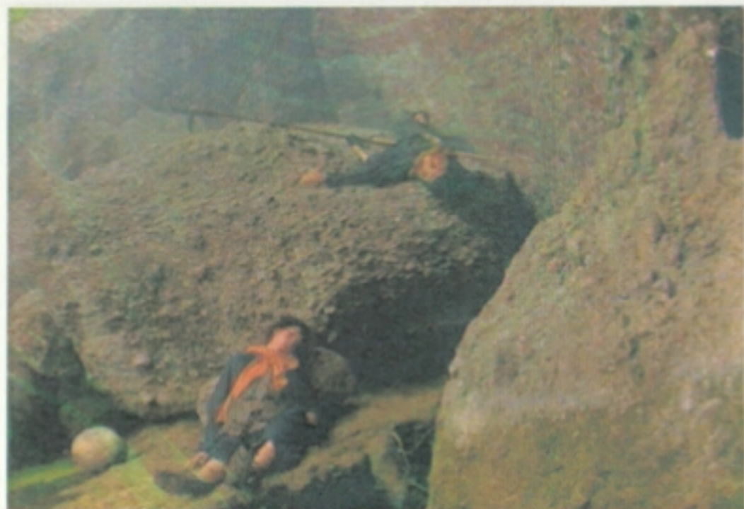
7 邓艾大军日夜兼程，一路悬崖林立，道路艰险，栈道飞架，苦不堪言，不时有兵士失手，坠入山谷丧命。