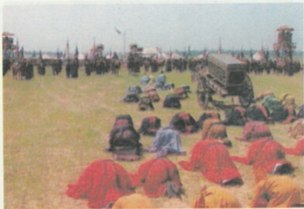
28 自先主刘备建国以来，历二帝 43 年，蜀汉灭亡。黄皓因欺君误国之罪，降魏后被凌迟处死。